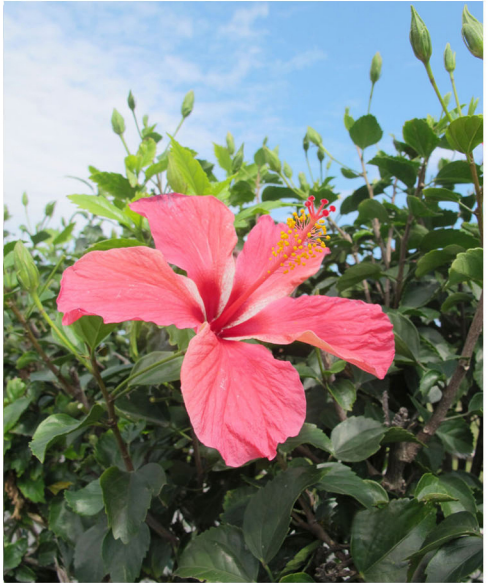
生机盎然